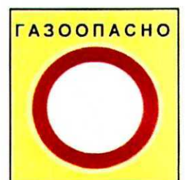
Проход и проезд запрещены – газоопасно!