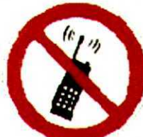
Запрещается пользоваться мобильным телефоном