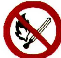
Запрещается пользоваться открытым огнем и курить