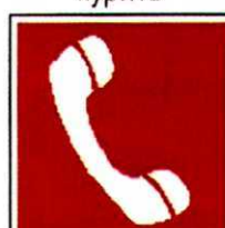
Телефон для использования при пожаре