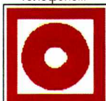
Кнопка включения систем пожарной автоматики