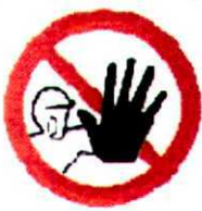
Доступ посторонним запрещен