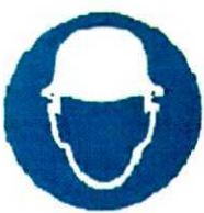
Работать в защитной каске